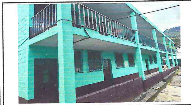
Mantenimiento de red eléctrica