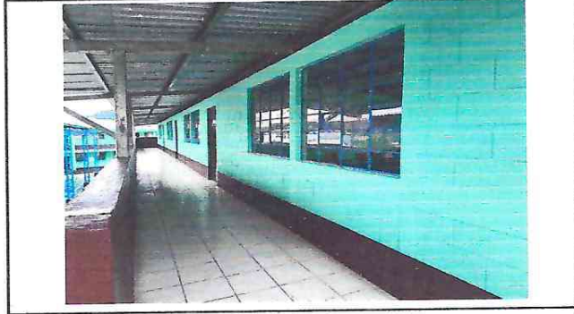
Aplicación de pintura en muros exteriores