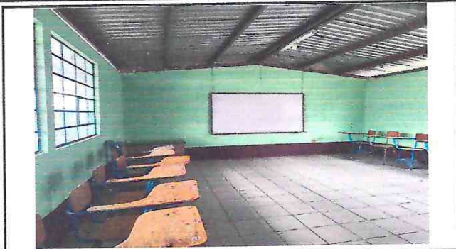
Aplicación de pintura en muros interiores