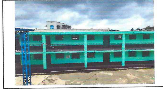
Aplicación de pintura a puertas de metal