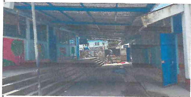
Culminación total de la estructura metálica del corredor de la escuela