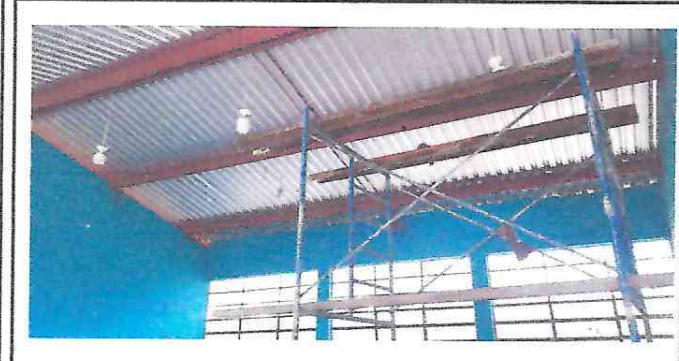
Foto 1: Colocación de láminas troquelada e instalación de cables eléctricos