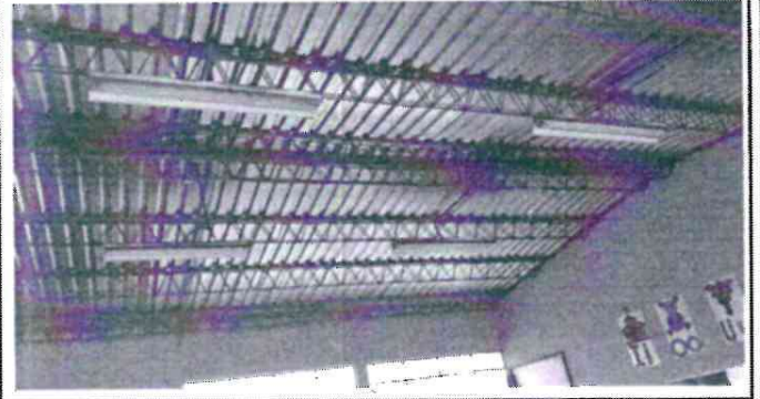
REPARACION DE SISTEMA ELECTRICO