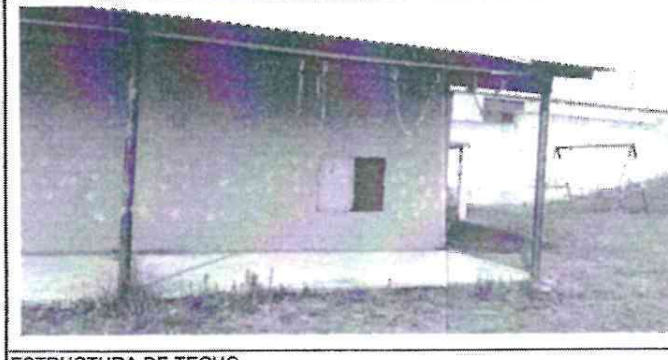
ESTRUCTURA DE TECHO