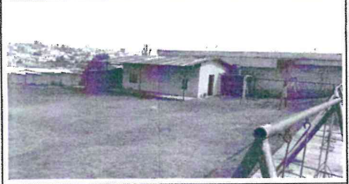
SUSTITUCION DE LAMINAS