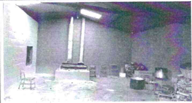
REPARACION DE COCINA