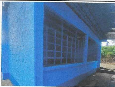
MANTENIMIENTO A BARRANDAS TERMINADA