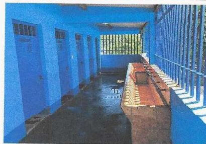
RED DE AGUA POTABLE TERMINADA

Observación: Si es necesario se pueden agregar hojas adicionales y actualizar el número de hojas.