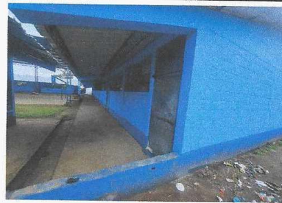
PINTURA EN MURO EXTERIORES E INTERIORES