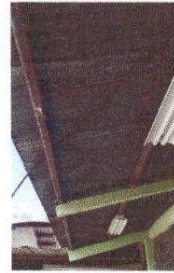
Foto 8: Cubierta de lamina de modulo de aulas requieren mejoramiento.