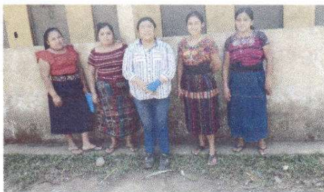
Foto 11: Evaluador con directora e integrantes de OPF en servicios sanitarios.