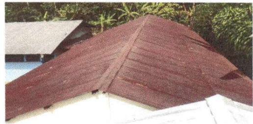
Foto 10: Cubierta de lamina de modulo de aulas requieren mejoramiento.