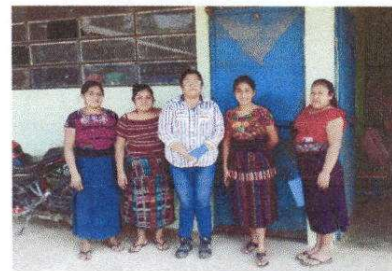
Foto 12: Evaluador con directora e integrantes de OPF en modulo de aulas 1.