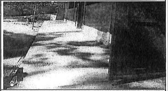
CORREDOR TERMINADO Y FINALIZADO, CON SU RESPECTIVA LIMPIEZA YA.