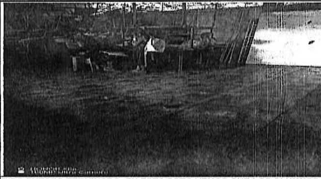
PISO PUESTO TERMINADO, EN ESTA FOTO VEMOS QUE LOS ALUMNOS YA GOZAN DE ELLO.