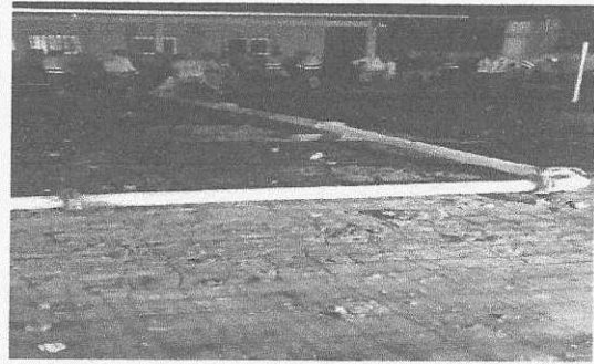
losa de patio en proceso.