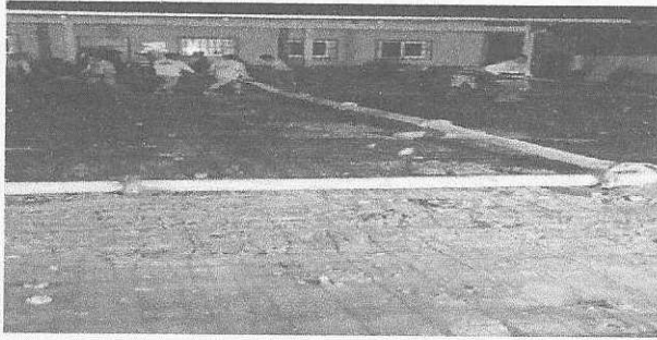
1. losa de patio en proceso