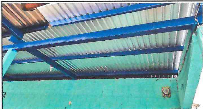
Foto 3. Cambio de Costaneras de madera.