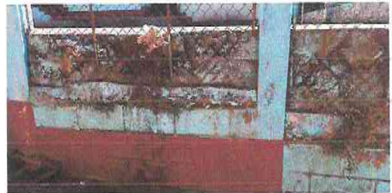
pintada de muro

Observación: Si es necesario se pueden agregar Hojas adicionales y actualizar el número de hojas.