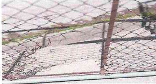
Cambio total del porton de entrada