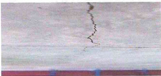
sustitucion de los pisos en los baños