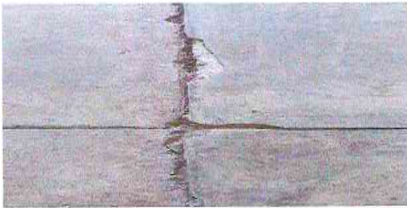
sustitucion de piso en el aula