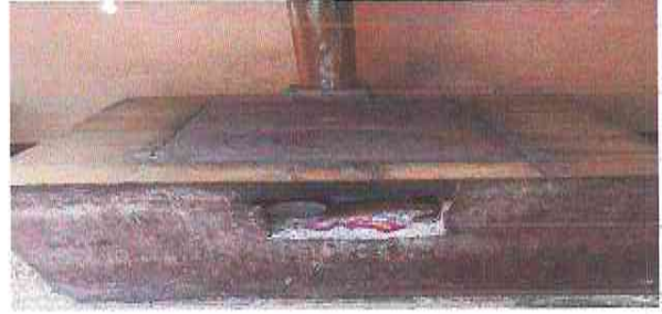
Reconstruccion total de la cocina