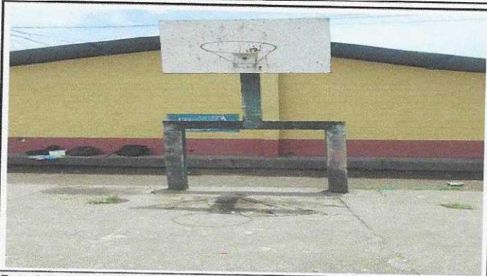
Foto 1. losa de patio en mal estado.