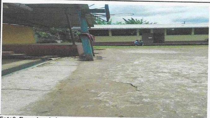
Foto 3. Espacios de la cancha en malas condiciones.