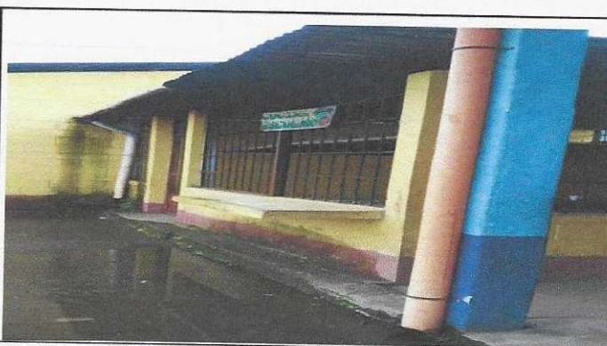
Foto 4. Area de la cocina en mal estado.