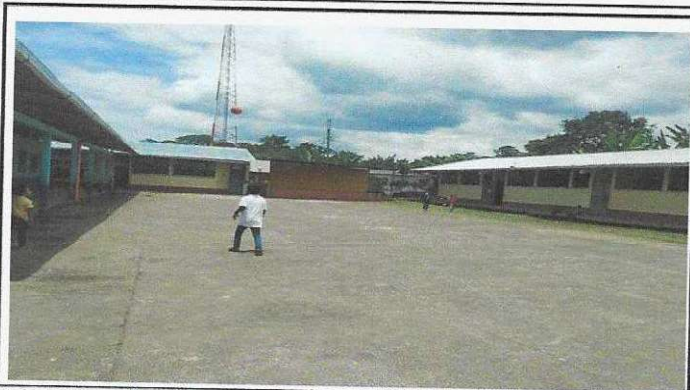
Foto 2. Necesita mejorar la cancha.