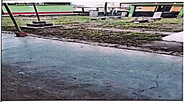
foto No. 4 reparacion losa de patio escolar