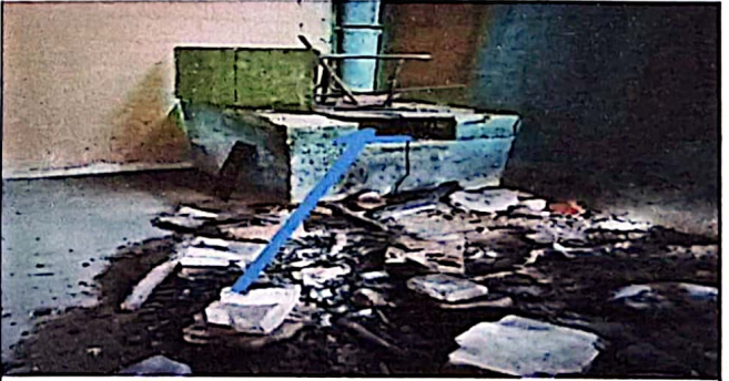
FOTO 6 reparacion de estufa rural.

Observación: Si es necesario se pueden agregar fotos adicionales y actualizar el número de hojas.