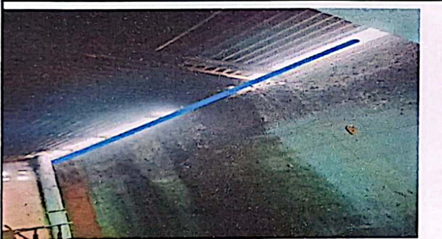
FOTO No. 3 reparacion techo de cocina y su pintada