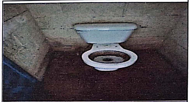
No. Mal estado de inodoro y pintura