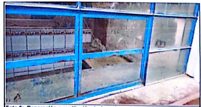
Foto 6: Reparación o sustitución de área de cocina (estufas rurales, pilas, ventanas, puertas, chimineas, otros)

Observación: Si es necesario se pueden agregar hojas hasta un máximo de 10, indicando el número de hojas.