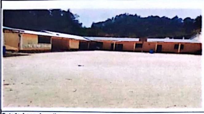
Foto1: Losa de patio