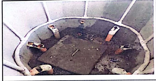
FOTO 4 REPARACION DE REPOSADERA