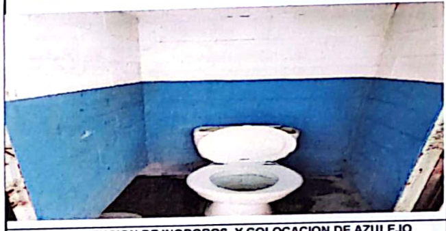
FOTO 2 SUSTITUCION DE INODOROS. Y COLOCACION DE AZULEJO