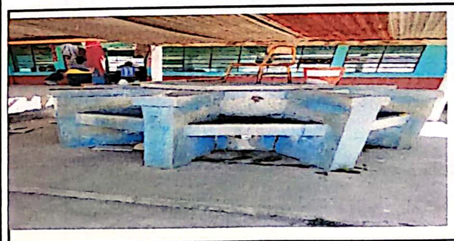
FOTO 5 SUSTITUCION DE LLAVES DE CHORROS EN LAVAMANOS Y PINTURA