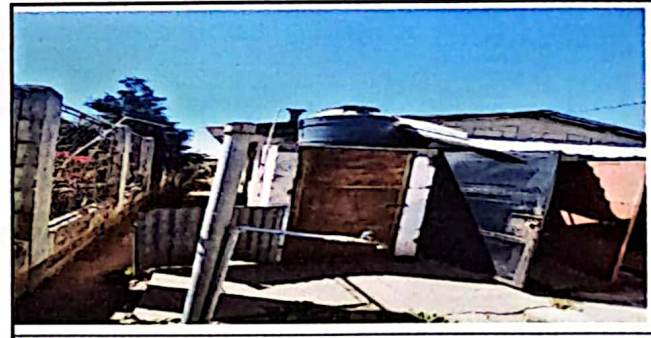
FOTO 6 CAMBIO DE PUERTA Y TINACO

Observación: Si es necesario se pueden agregar hojas adicionales y actualizar el número de hojas.