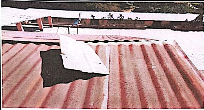
Foto1: Cambio de Techado del aula