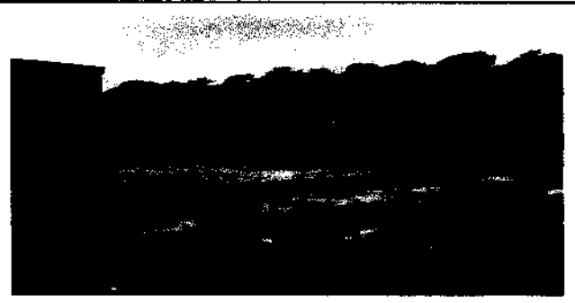
FOTO: FALTA DE INSTALACIÓN DE PORTÓN No. 2 ENTRADA EN EL CAMPO DE FUTBOL.

Observación: Si es necesario se pueden agregar hojas adicionales y a utilizar el reverso de las.