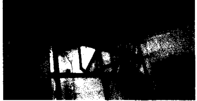
FOTO 2: ESTADO DE LAS VENTANA DE LA COCINA DE LA EORM TECUN UMAN.