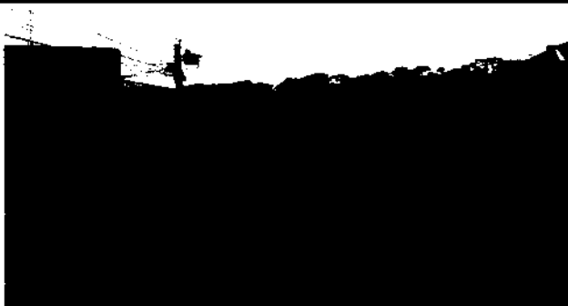
FOTO 5 FALTA DE INTALACIÓN OE PORTON No. 1 ENTRADA EN LA GANCHA POLIDEPORTIVA.