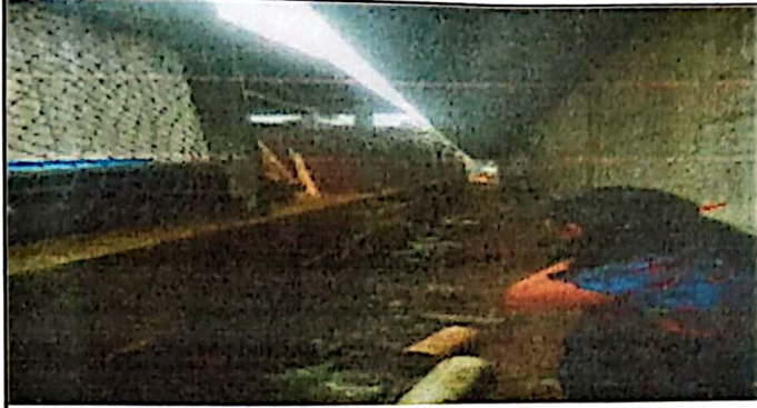
Foto 1: Muro o cerco perimetral de mallas deterioradas a instalación de Block