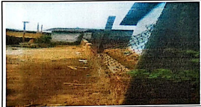
Foto 3: Cerco o muro perimetral en mal estado a instalación de Block