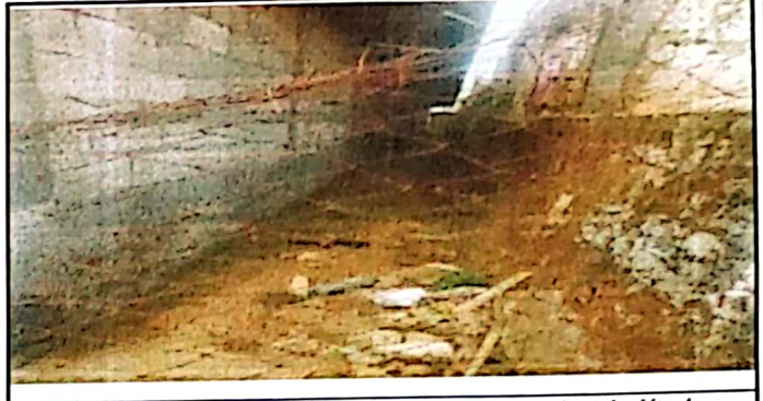
Foto 2: Muro o cerco perimetral de mallas deterioradas a instalación de Block