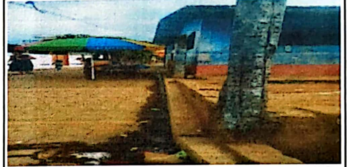
Foto 4: Cerco o muro perimetral en mal estado a instalación de Block