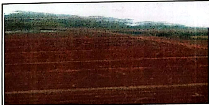
Foto 5: estructura de Techo y Lamina deteriorada a nuevas laminas e costaneras