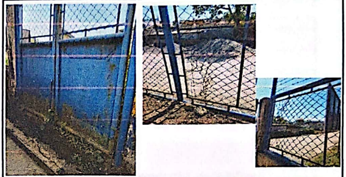
Foto 8: Ingreso de escorrentía de agua pluvial en predio escolar por falta de muro de concreto -portón alterno inhabilitado-. Deterioro de mallas en 5 secciones del perímetro.