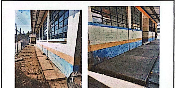
Foto 10: Deterioro de pintura en paredes interiores y exteriores de aulas.