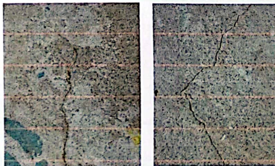
Foto 6: Rajadura de piso rústico en uno de los módulos mas antiguos del establecimiento.

Observación: Si es necesario se pueden agregar hojas adicionales y actualizar el número de hojas.