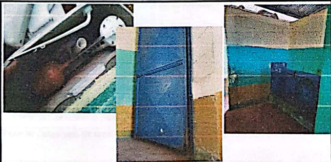
Foto 3: Mal funcionamiento de accesorios de sanitarios y deterioro de puerta de los servicios sanitarios.