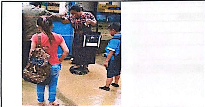
Foto 7: Inundación de entrada del establecimiento en época de invierno por falta de tragante de agua.