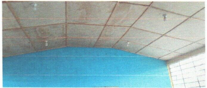
Foto 2: Mejoramiento de machimbre y sistema electrico iluminación en modulo de aulas 1.