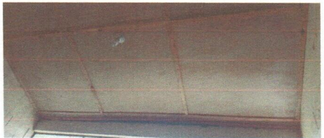
Foto 4: Mejoramiento de machimbre y sistema electrico iluminación en modulo de aulas 1.