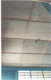
Foto 1: Mejoramiento de machimbre y sistema electrico iluminación en modulo de aulas 1.