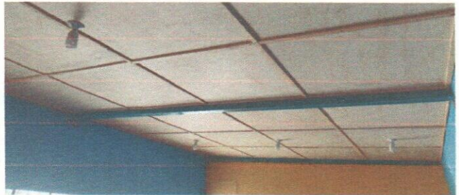
Foto 6: Mejoramiento de machimbre y sistema electrico iluminación en modulo de aulas 2.