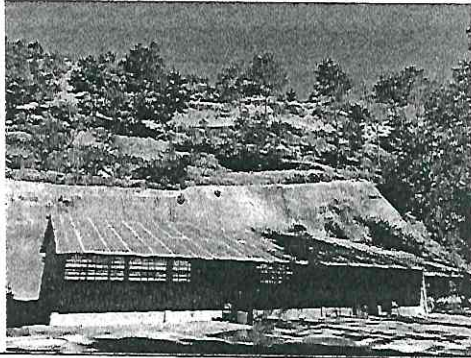
Aulas y direccion necesita cambio de lamina