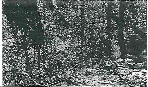
Espacio del lado sur necesita de muro de contencion.