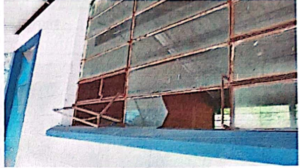
Foto No. 2. Vidrios deteriorados