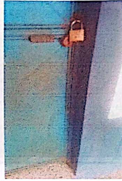
Foto No. 4. Puertas inseguras sin chapa.