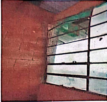
Foto No. 1. Base de ventanas en mal estado