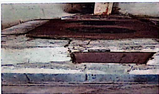
Foto 5. Estufa de escuela en mal estado.