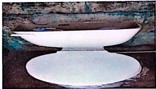
Foto 4. Es necesario el cambio de inodoro con sus accesorios