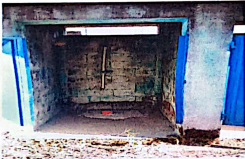
Foto 3. Falta instalación de inodoro y sus accesorios