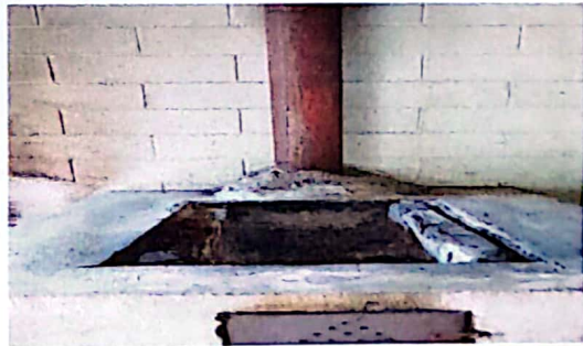
Foto 6. Es necesario la sustitución completa de la estufa de la escuela.

Observación: Si es necesario se pueden agregar hojas adicionales y registrar el número de hojas.