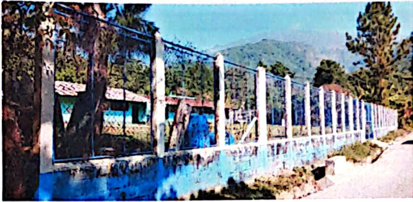
Foto 1. La circulación de la escuela se necesita pintar.