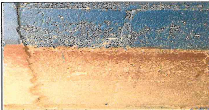
Foto 5: Reparación de paredes exteriores de las aula por cernido de cemento.