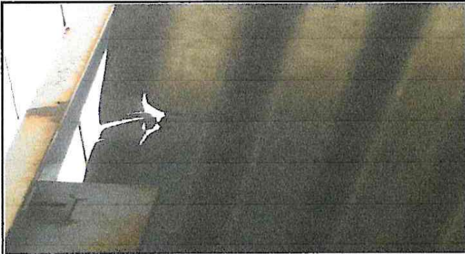
Foto 1: Sustitución de láminas, por láminas troqueladas calibre 24.