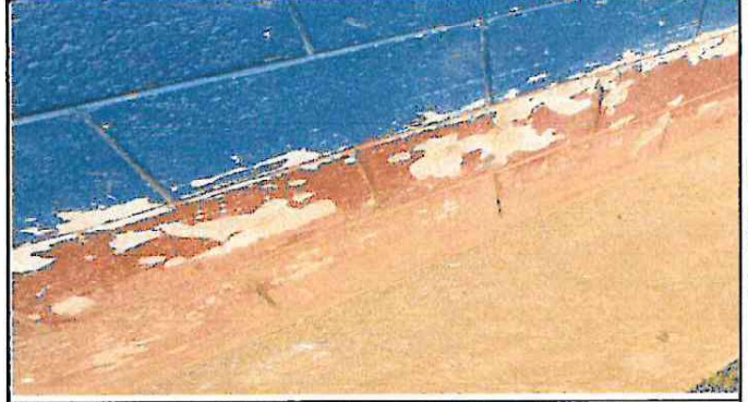
Foto 2: El color de las paredes de la escuela está en mal estado.