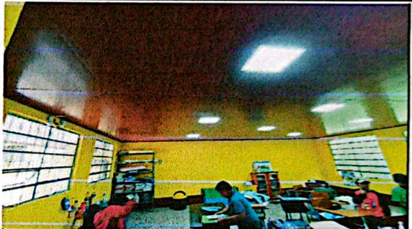
Foto 2: INSTALACIÓN DE SISTEMA ELECTRICO DE ILUMINACIÓN Y CIELO FALSO