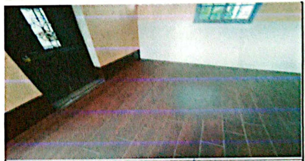
Foto 12: VISTA LATERAL DE LA INSTALACIÓN DE PISO CERAMICO Y AZULEJO EN MURO