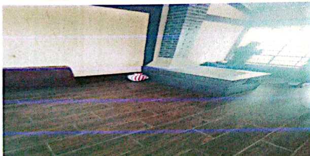
Foto 9: INSTALACIÓN DE LAMINA EN MÓDULO DE AULAS, INSTALACIÓN DE CANAL Y BAJADAS DE AGUA