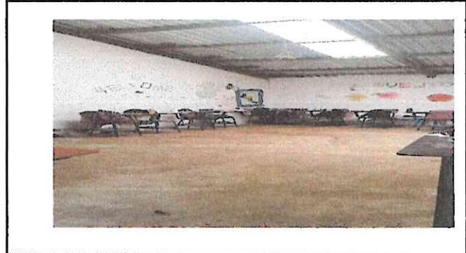
Foto 2: Remozamiento de piso del aula de cuarto y Quinto grado en muy mal estado.