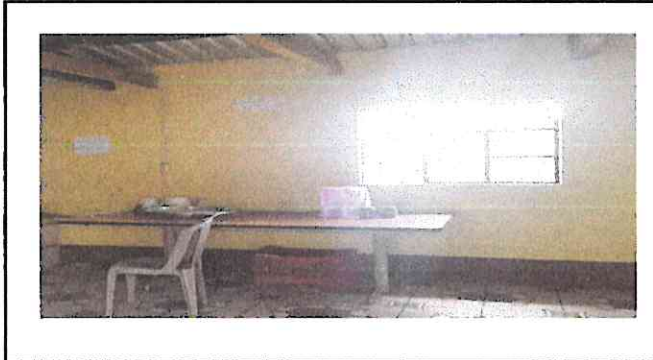
Foto1: Mejoramiento de cocina