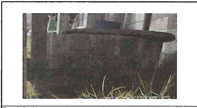
Foto 5: Problemas con el pozo, para el abasacimiento de la escuela.