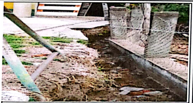
Foto 2: El desprendimiento, pone en riesgo la locomoción de los estudiantes.