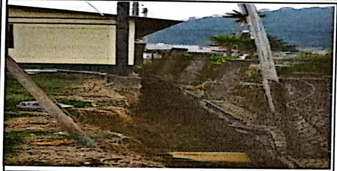
Foto 1: Con el desprendimiento del muro perimetral, se corre el peligro que se desplome la cocina escolar.