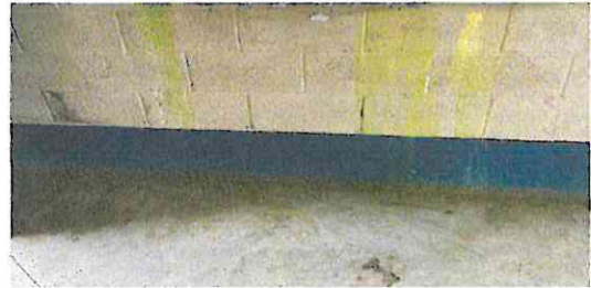
Foto 14: Espacio para fabricación de Gabinete de cemento en cocina.