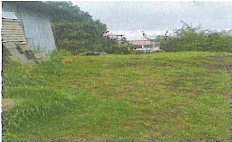
Foto 17. Creación de galera.