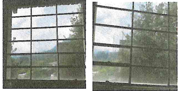
Foto 8: Fabricación e instalación de balcon se corre el riesgo de que entren a robar.