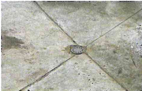
Foto 3 colocación piso granito ya que es concreto