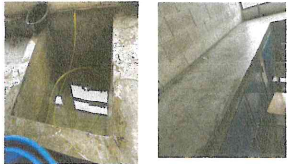
Foto 12: Instalación de azulejo por dentro de la pila por dentro y por fuera

Observación: Si es necesario se pueden agregar hojas adicionales y actualizar el número de hojas.