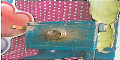
Foto1: Sustitución de chapas