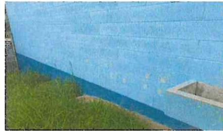
Foto 16 Creación de una pila.