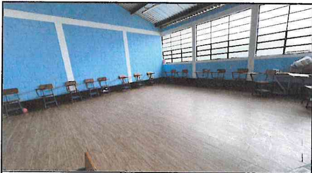
Foto 3: 100 % de colocacion de pizo tipo porcelanato en primer aula