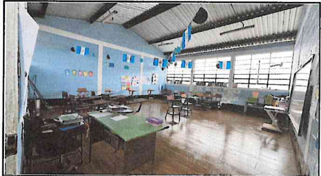
Foto 2: 100 % de colocacion de pizo tipo porcelanato en dos aulas