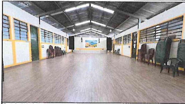
Foto1: 100 % de colocacion de pizo tipo porcelanato en el salon de usos múltiples