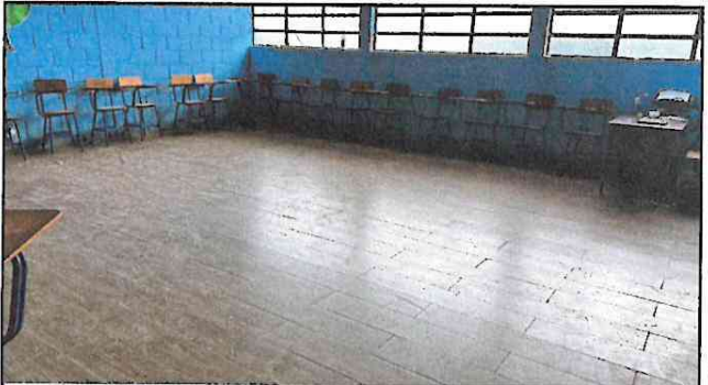
Foto 4: 100 % de colocacion de pizo tipo porcelanato en en segundo aula