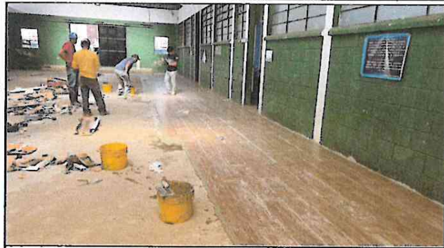
Foto1: Avance del 25% de colocación de piso tipo porcelanato en el salon de usos múltiples