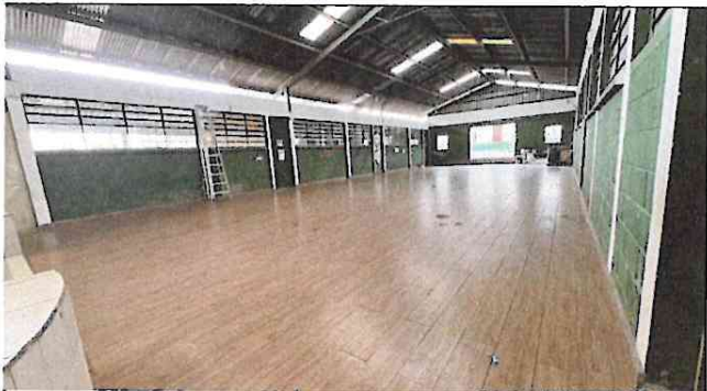
Foto 3: Avance del 90% de colocación de piso tipo porcelanato en el salon de usos múltiples