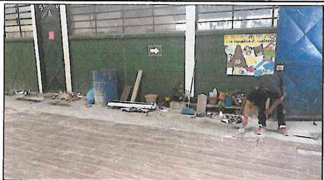
Foto 2: Avance del 75% de colocación de piso tipo porcelanato en el salon de usos múltiples