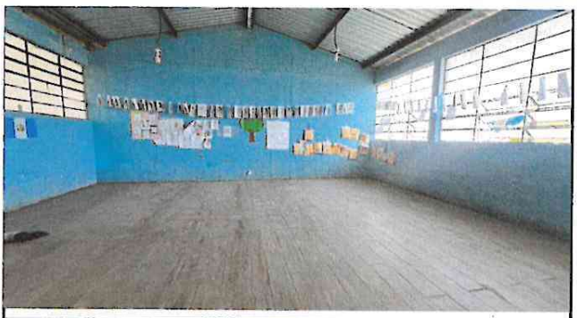
Foto 4: Avance del 80% de colocación de piso tipo porcelanato en dos aulas