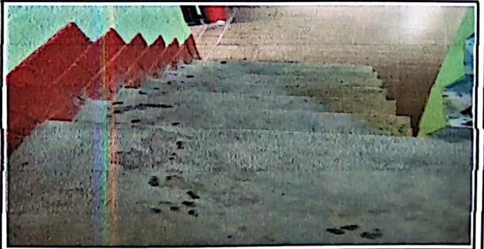
Foto No. 6: Sustitucion de Torta de Cemento por Piso Ceramico, adecuado para las gradas.

Observación: Si es necesario se pueden agregar hojas adicionales y actualizar el número de hojas.