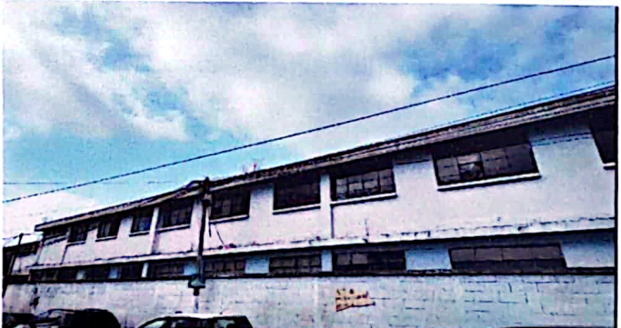
foto 4: es necesario reparación de las ventanas y balcones de todas las ventanas.