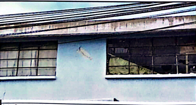
foto 5: aca tambien se ve el deterioro de las ventanas y los vidrios quebrados y la falta de balcones.