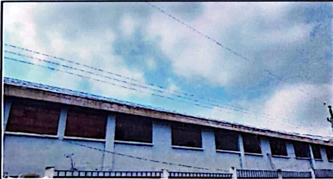
foto 3: se ve el deterioro de las ventanas por falta de balcones con mallas.