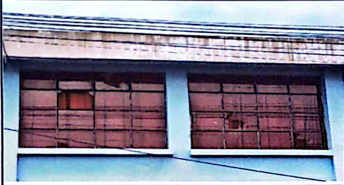
foto 1: repación de ventanas, vidrios y balcones con malla metalica para que no rompan los vidrios con piedras.