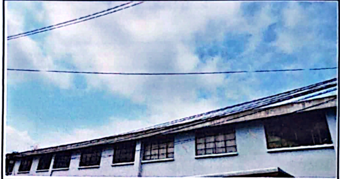
foto 2: ninguna de las ventanas del 2do. Nivel cuenta con balcones para proteger a los estudiantes de las piedras que tiran malas personas.