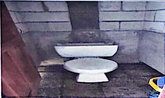
FOTO 1. SANITARIO EN MAL ESTADO.