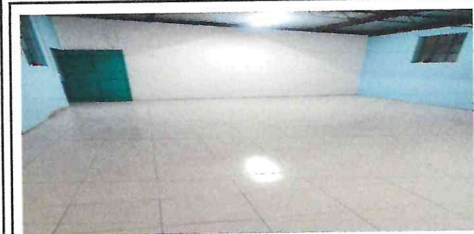
Foto 11: Finalización de la colocación del piso cerámico en el aula.