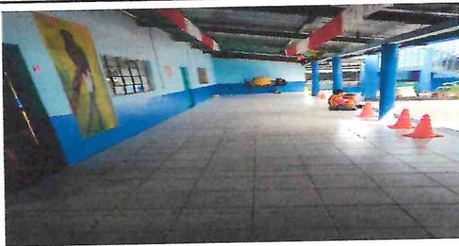
Foto 3: Finalización de colocación de piso cerámico en el corredor.