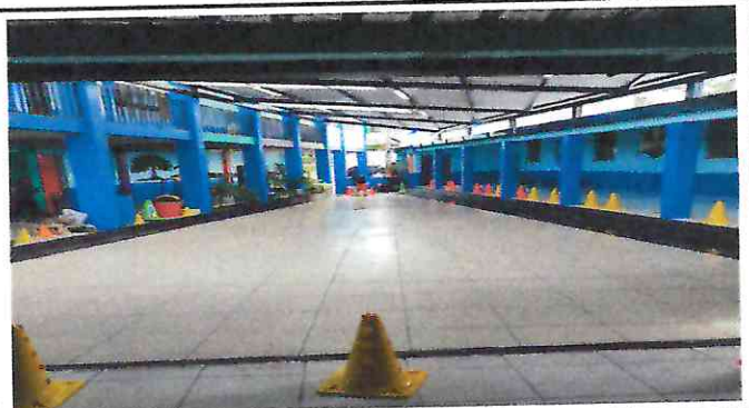
Foto 4: Finalización de colocación de piso antideslizante e iluminación en el techo del patio cívico.