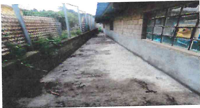
Foto 1: Culminación de losa con un alizado en las paredes de las aulas para evitar la humedad.