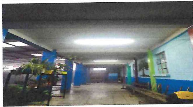
Foto 8: Finalización de la instalación de lámparas led en los pasillos del primer y segundo nivel.