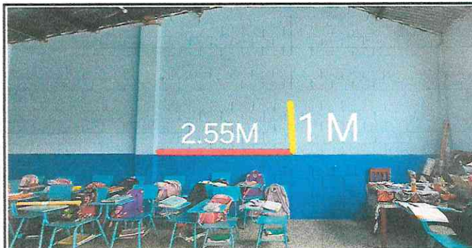
Foto 5: En el aula de 5To. Primaria hay poca ventilación e iluminación por lo que se necesita una ventana más.