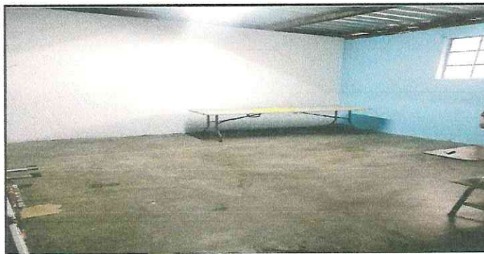
Foto 11: No se cuenta con piso en el aula y la torta de cemento esta deteriorandose.