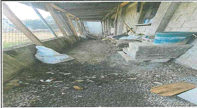
Foto 7: El patio no cuenta con losa propiciando que se humedezcan las paredes de las aulas.