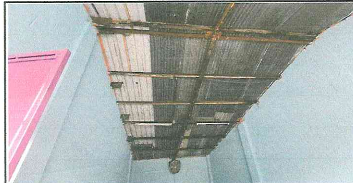
Foto 6: Techo del aula en mal estado al igual que las lámparas estan en mal estado.

Observación: Si es necesario se pueden agregar hojas adicionales y a utilizar el número de hojas.