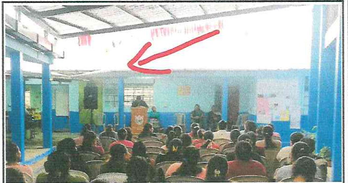
Foto 10: No se cuenta con un canal de aguas pluviales en el patio cívico.