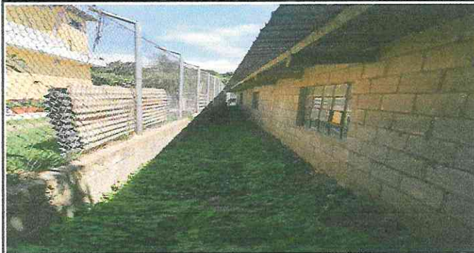
Foto 1: No se cuenta con canal de agua pluvial de concreto y afecta las paredes de las aulas