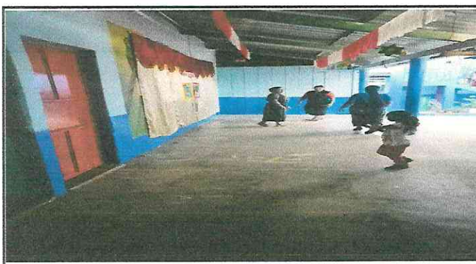
Foto 3: Corredores que no cuentan con piso, el cual estan en mal estado.