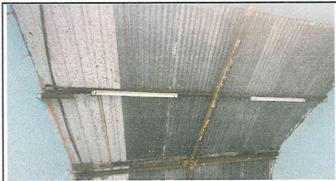
Foto 9: El sistema de iluminación es obsoleto e ineficiente porque solo se cuenta con cuatro lamparas en las aulas y no cumplen su función.