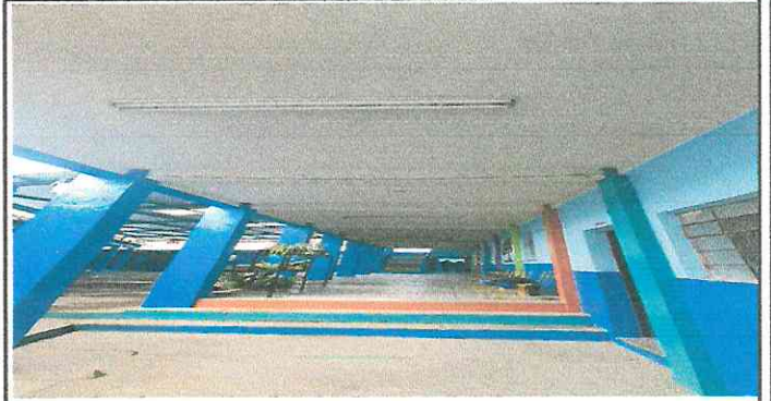
Foto 8: En los corredores del primer y segundo nivel del modulo 3 no se cuenta con lámparas estan en mal estado.