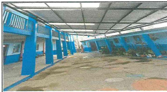
Foto 4: Patio cívico que no cuenta con piso, está en mal estado y falta de iluminación en el techo.