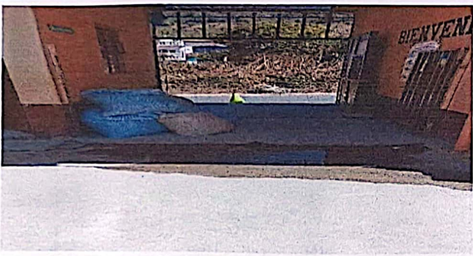
Foto 3: Sistema de captación y evacuación de agua pluvial en patio.