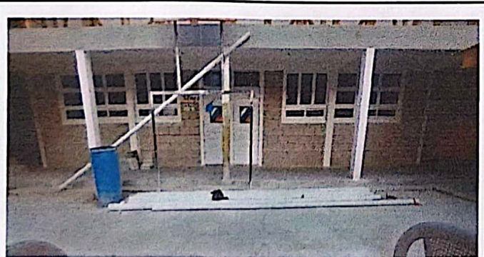
Foto 5: Suministro e instalación de balcones de metal para ventanas.