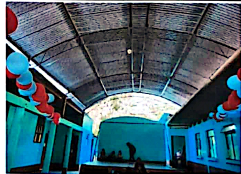
Foto 6: Área donde se colocará la iluminación en techo y escenario.

Observación: Si es necesario se pueden agregar hojas adicionales y actualizar el número de hojas.