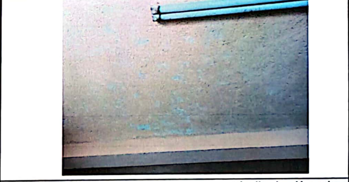
Foto 4: Cambio lámpara por plafoneras para una mejor iluminación en la preparación de los alimentos.