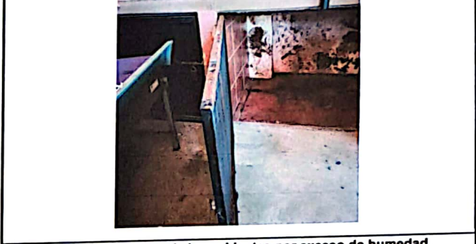
Foto 2: Reparación dentro de los gabinetes por exceso de humedad.