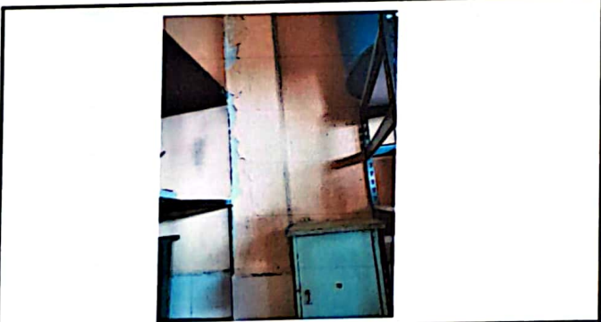
Foto 3: Tratamiento de paredes dañadas por dentro de la cocina, por exceso de humedad.