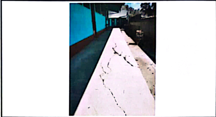
Foto 2: Área donde se colocará el piso en el módulo sur de la escuela.