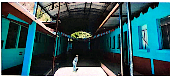
Foto 5: Área donde se colocará la iluminación, vista de la entrada.