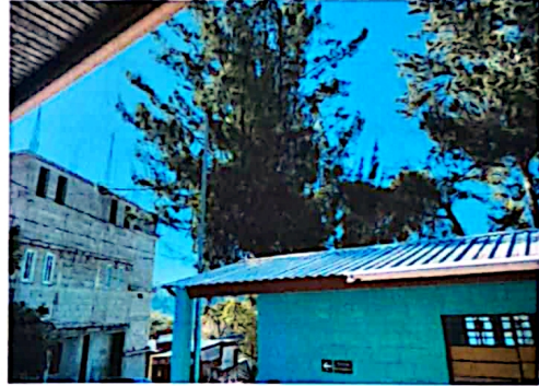
Foto 2: Área donde se realizará la terminación del laminado y techado, vista desde adentro.