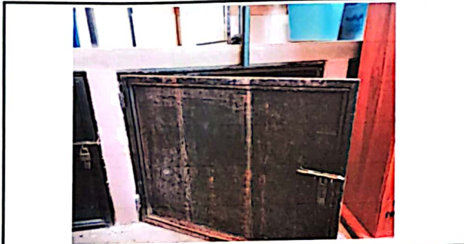
Foto 1: Reparación y pintada de puertas de gabinetes, están oxidadas y dañadas por el tiempo que no se utilizó.