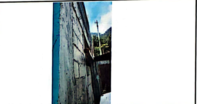
Foto 5: Parte de atrás de la cocina donde se le dará tratamiento para evitar la humedad dentro de la cocina.