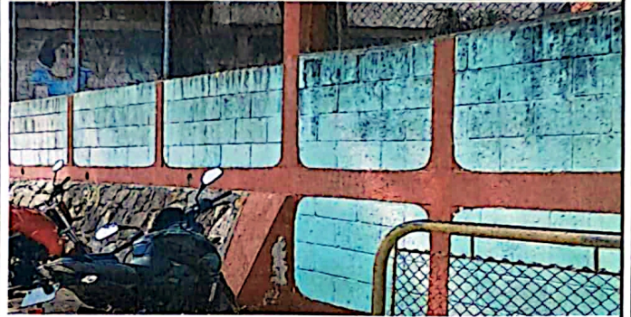
Foto 8: paredes que necesitan mantenimiento y que llevan años sin ser pintadas