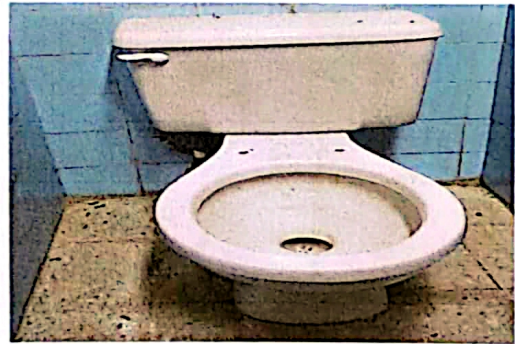
Foto 10: Sustitución de accesorios a inodoros (contra llave, tubo de abasto y tanque)