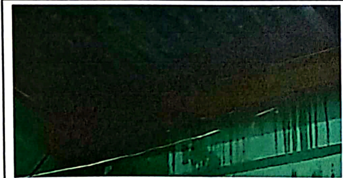
Foto 3: pared y techo en mal estado con filtración de agua en tiempo de lluvia