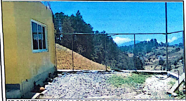
SE CONSTRUIRÁ UN AULA DE TRES PAREDES EN ESTE ESPACIO CON TECHO DE TERRAZA, PISO ALISADO, UNA PUERTA Y UNA VENTANA DE UN METRO CUADRADO.