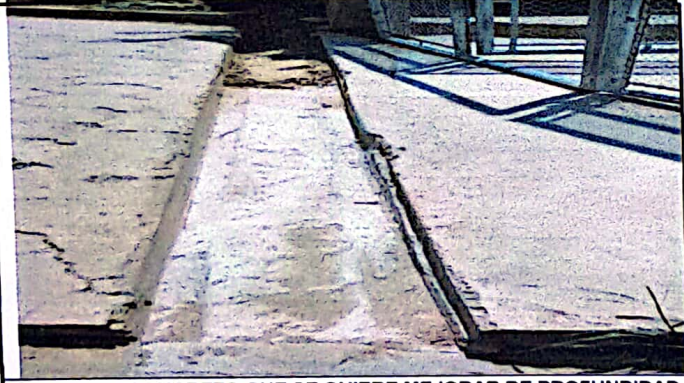
CUNETETA DE CONCRETO QUE SE QUIERE MEJORAR DE PROFUNDIDAD.