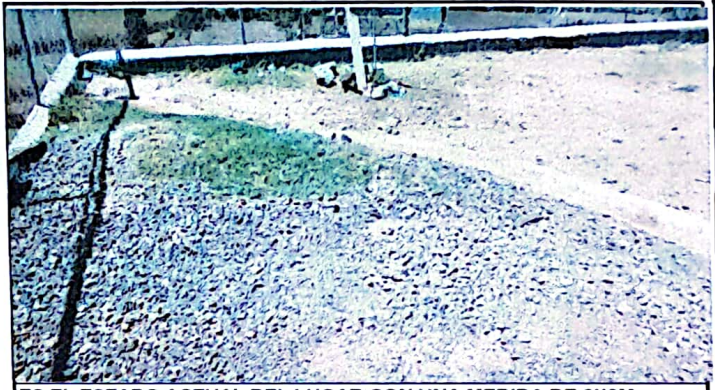
ES EL ESTADO ACTUAL DEL LUGAR CON UNA MEDIDA DE 6X6M.