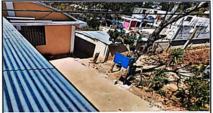
FOTO 2: Hace falta completar el techo de la cancha, donde los niños realizan educación física, en temporada de verano e invierno les afecta.