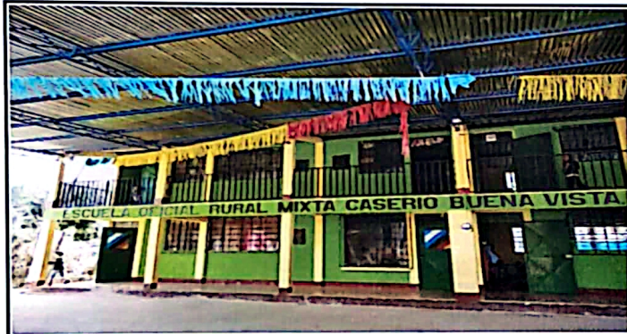
FOTO 3: Hace falta iluminación frente al centro educativo y en la cancha deportiva.