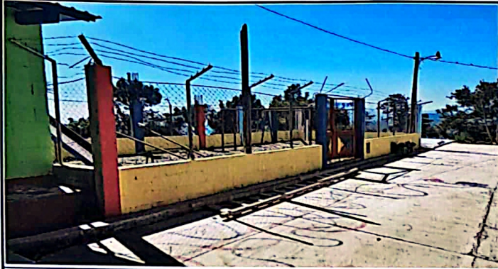
FOTO 1: El parque infantil para los niños del nivel de preprimaria no cuentan con techo. En temporada de verano e invierno les afecta a los alumnos.