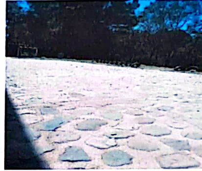
Foto 2: El patio del centro educativo no se encuentra en condiciones para las distintas actividades de aprendizaje, razón por la cual se tiene contemplado las mejoras para el mismo.