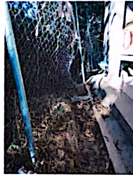
Foto 4: Se ha planificado colocar base de block para luego instalar la malla galvanizada.