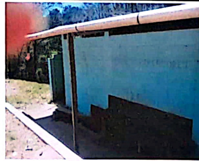
Foto 6: Se necesita pintura nueva para los muros interiores y exteriores así mismo la reparación de accesorios de los sanitarios, igualmente la sustitución del techo de lámina.

Observación: Si es necesario se pueden agregar hojas adicionales y actualizar el número de hojas.