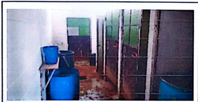
Foto 3: Sustitución de piso de concreto por piso de ceramico, cambios de puertas y azulejos en los baños.