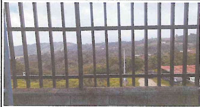
Foto1: Colocación de barandas.