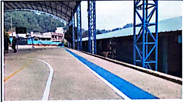
Foto 2: La cancha no cuenta con una seguridad al momento de realizar actividades, por lo que es peligroso para los alumnos