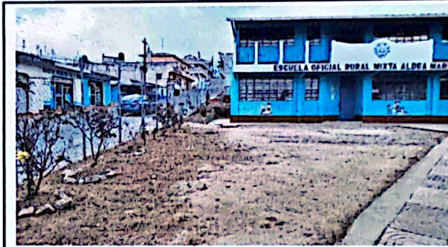
Foto 4: Vista del patio sin pavimento, este es antihigienico para los alumnos de la escuela.