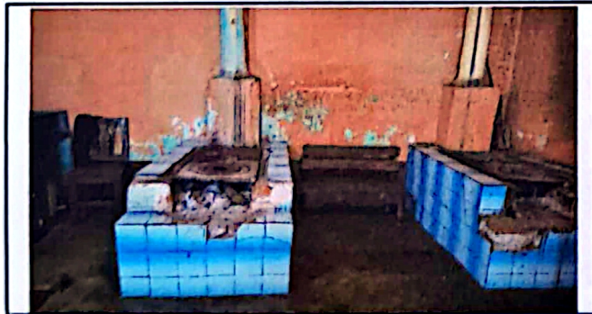
Foto 5: Vista de las estufas rurales, estas ya no cumplen la función de preparar los alimentos, así como las paredes están en mal estado.