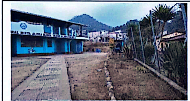
Foto 3: Patio 2 de la escuela, se observa las areas faltantes de pavimento.