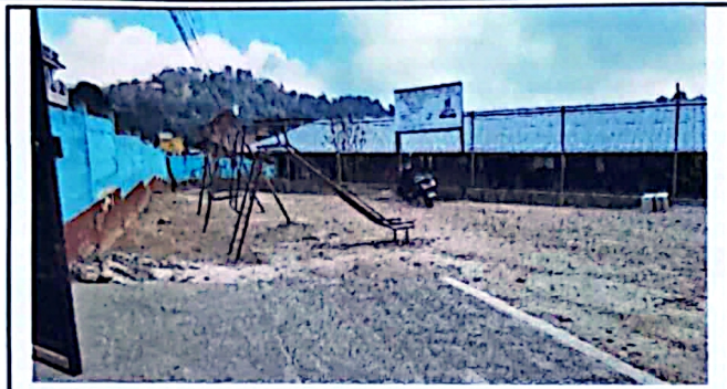
Foto 1: Patio 1 de la escuela de la localidad, se encuentra sin ninguna protección como pavimento.