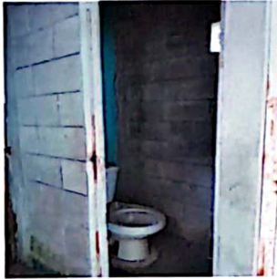
Servicio sanitario en mal estado