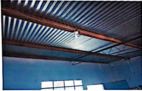
Sistema eléctrico en mal estado