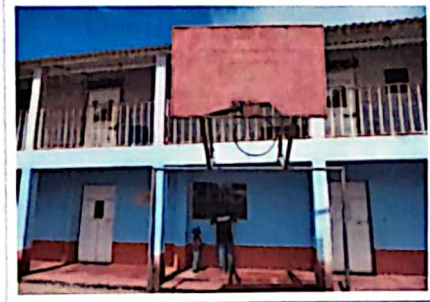
corredor y patio en muy mal estado.

Observación: Si es necesario se pueden agregar hojas adicionales y agregar al Registro de Fotos.