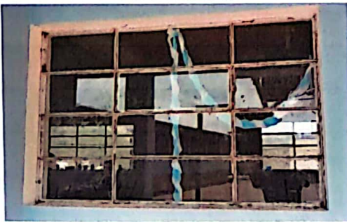
Ventanas sin barandas de protección.