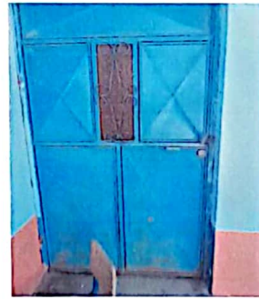
Pintura de Paredes y puertas en mal estado.