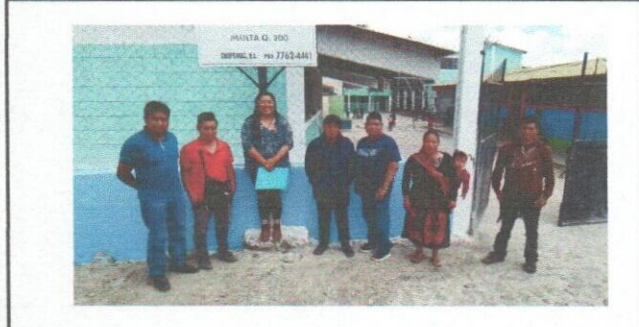
Foto 11: Evaluador con director e integrantes de OPF en fachada frontal del establecimiento.