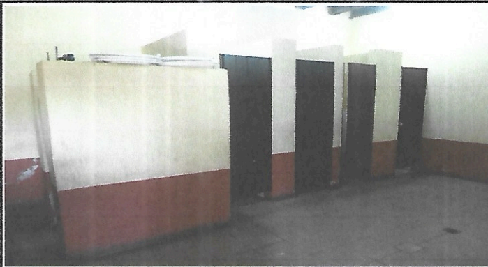
Foto 1: Los 9 sanitarios necesitan ser remozados pues constantemente se están cambiando llaves, mangueras, sapitos, etc. Y también presentan fugas, ya que los accesorios no tienen durabilidad.