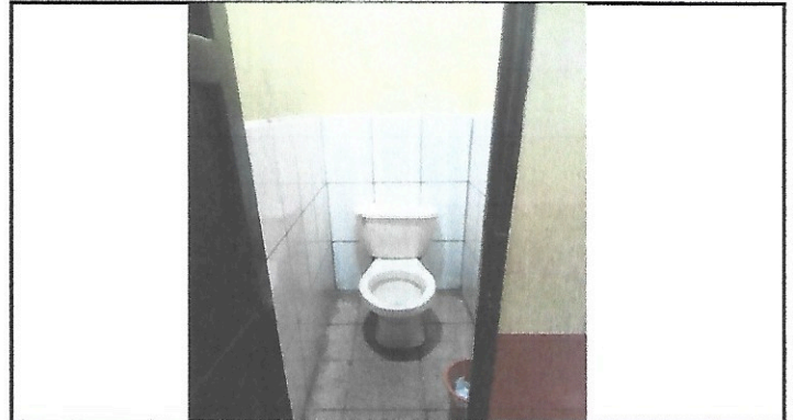
Foto 2: Los sanitarios actualmente no resisten para atender a 576 alumnas solo en una jornada, por lo mismo se busca que sean cambiados por otros mas resistentes.