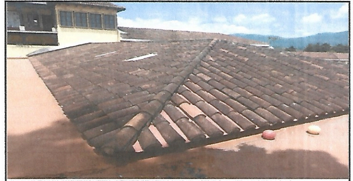
Foto 6: Existe una terraza que necesita se le hagan pañuelos para que el agua tenga desnivel para que no se acumule y provoque filtraciones.

Observación: Si es necesario se pueden agregar hojas adicionales y actualizar el número de hojas.