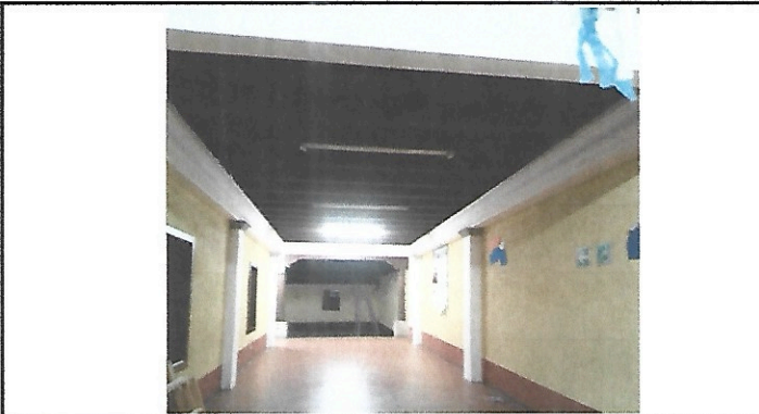
Foto 3: En los corredores de la escuela la iluminación es deficiente ya que son gasneones los que actualmente se poseen, algunos pasillos incompletos ya que con las vibraciones de bombas o temblores hace caerlos.