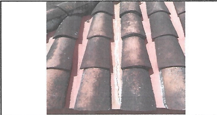
Foto 5: Las láminas duralita muchas de ellas están rajadas, así como varias tejas quebradas.