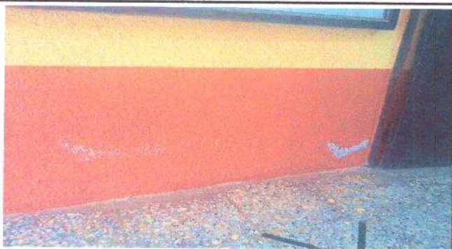
Foto 3: Módulo C- Aulas: Existencia de salitre en zócalo de los salones y corredores