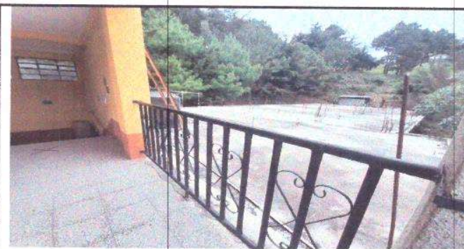
Foto 7: Módulo E - Agua Potable: Acceso inadecuado para ingresar a los depósitos de agua

Observación: Si es necesario se pueden agregar hojas adicionales y actualizar el número de hojas.