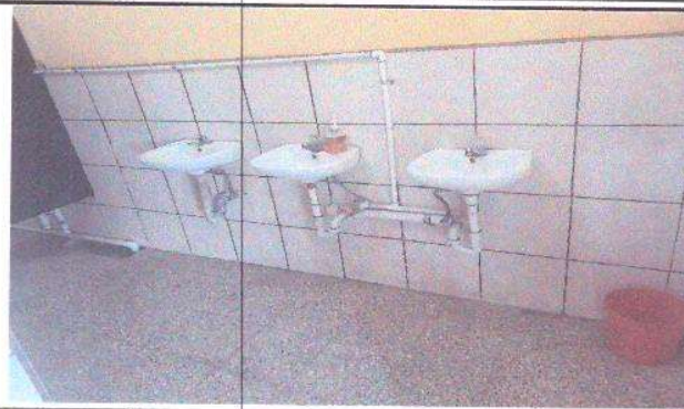
Foto 2: Módulo B - Sanitarios. Falta de base de soporte para lavamanos