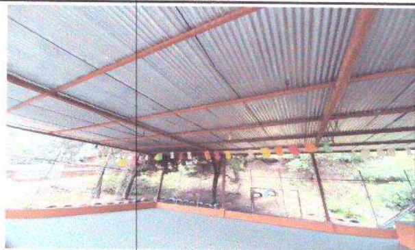
Foto 4: Módulo D- Galera: Estructura de Galera en mal estado (con óxido)