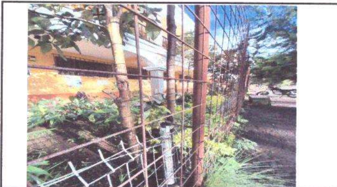
Foto 10: Módulo I- Estructura metálica (perímetro) - Pintura de malla perimetral en mal estado