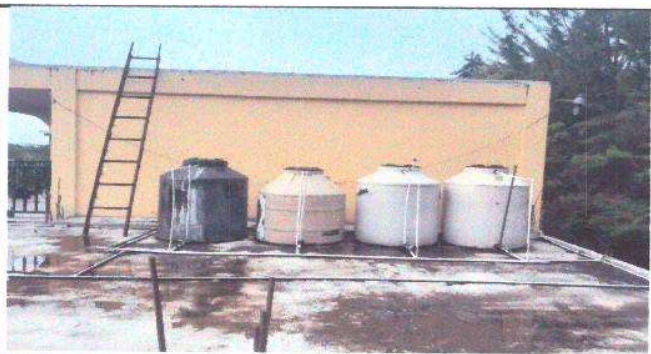
Foto 5: Módulo E- Agua potable: Depósitos de agua potable en mal estado.