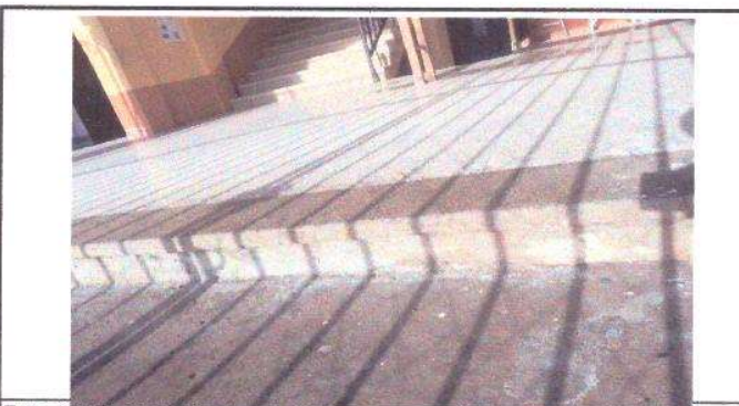
Foto 12: Módulo K: Gradas: Faltan rampas para el acceso al establecimiento.