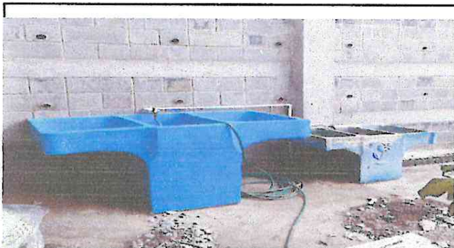
Foto 3: pila, tubería y drenaje en proceso, realizando reparaciones