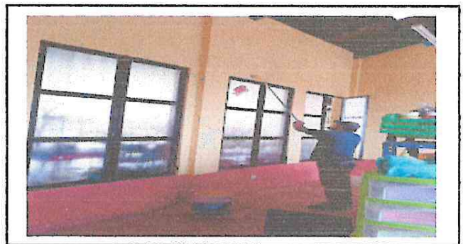
Foto 6: los ambientes estan siendo trabajados y separados, dando mantenimiento, pintura en las paredes

Observación: Si es necesario se pueden agregar hojas adicionales y actualizar el número de hojas.