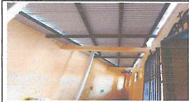
Foto 3: espacios mal acondicionado esta limpio para area de cocina