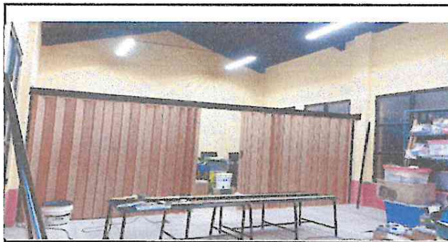
Foto 5: en un salón funcionan 3 ambientes, esta siendo remodelado