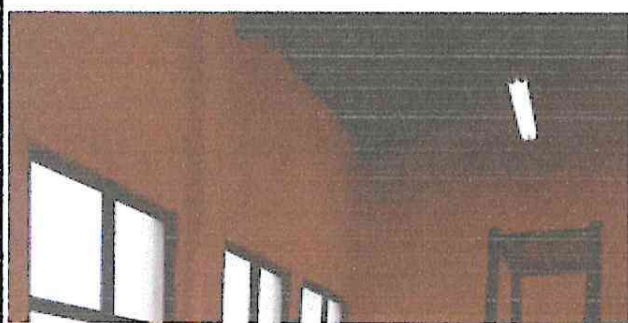
Foto 1: iluminación de los salones en proceso de cambio de gasneones