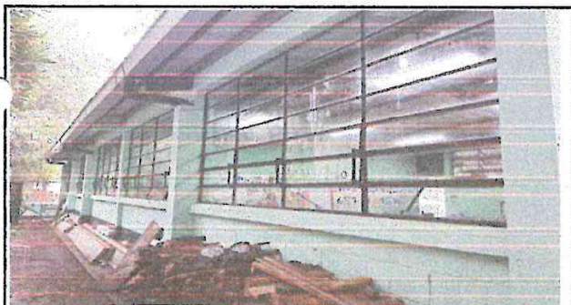
Foto 3: se colocarán balcones en las ventadas de la parte de atrás.