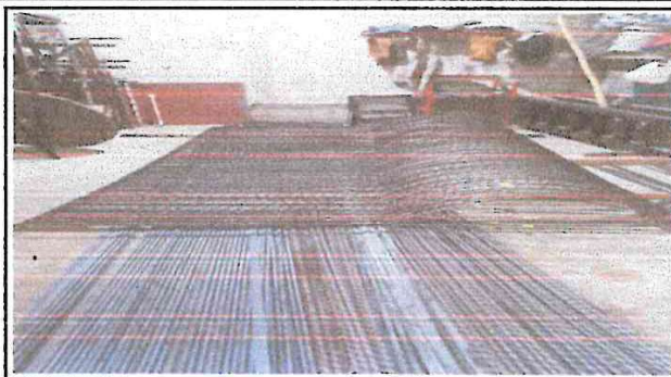
Foto 2: los balcones que se colocarán en las ventanas de la parte trasera de la escuela.